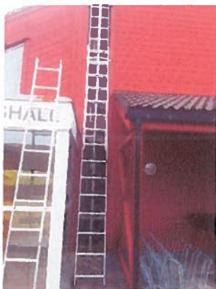
Et av prosjektene: vinduer i Sirahallen

Samlet sett synes det å være litt for mange store prosjekter på gang i forhold til administrativ bemanning, slik at framdriften lider noe. Samtidig er mange prosjekter kommet et godt stykke ut på beddingen og er satt i prosess. Prosjekt "gatelys" må samkjøres med midler avsatt til "Trafikksikkerhet" og tilsagn om midler til dette på kr 525.000.