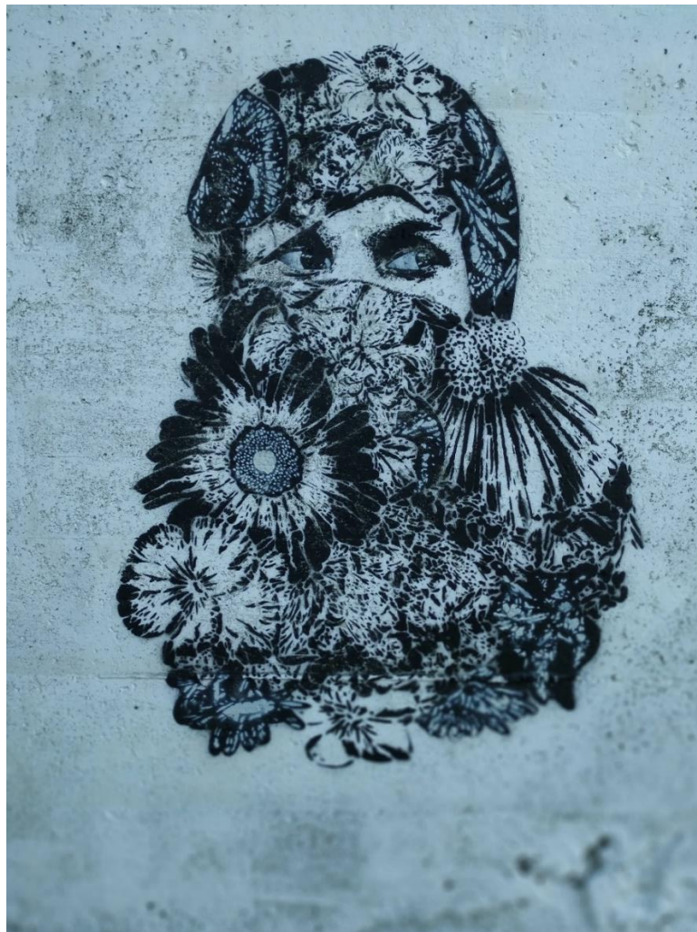
Icy&Sot – Street Art på vareskuret i Sør