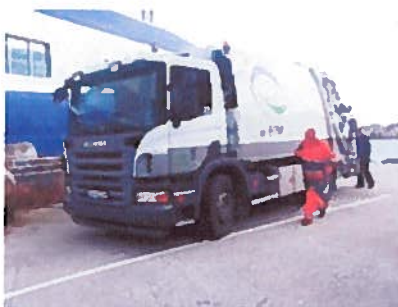
HIM as bruker 2 kammerbil i innsamlingen av avfall.

Utsira kommune har vedtatt å inngå avtale om innhenting av restavfall – mat – papir – plastemballasje med Haugaland Interkommunal Miljøverk AS (HIM). Avtalen vil tre i kraft fra mai 2012. Denne renovasjonsordningen vil bygge opp under Utsira sin grønne profil, når vi nå også får sortert ut og samlet inn matavfall og plastemballasje særskilt. På lag med HIM vil vi få tilgang til bedre returordninger og de samarbeidsavtaler som våre IKS selskaper har. Vi får frigjort ressurser i teknisk drift slik at vi kan fokusere på øvrig tjenestetilbud til våre innbyggere.