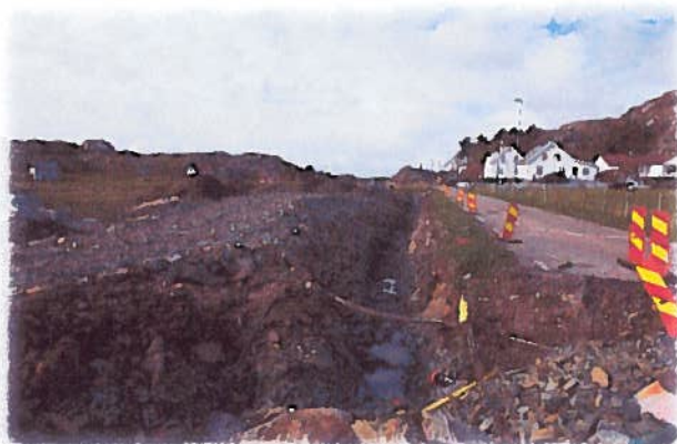
Vann og avløp og låneopptak