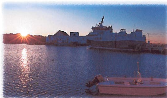
Sol over Sørevågen 1.mai